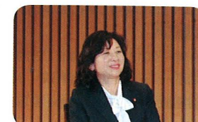
特別企画 野田聖子・総務大臣